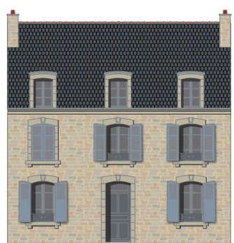
Contraste chaud-froid entre le granit ocré et les bleus des éléments ponctuels.