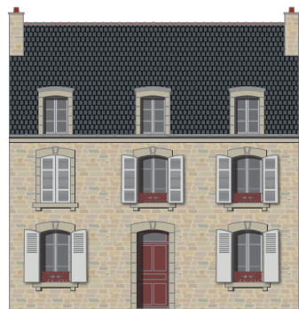
La porte d'entrée et les ferronneries sont de couleur sombre en contraste avec le granit.