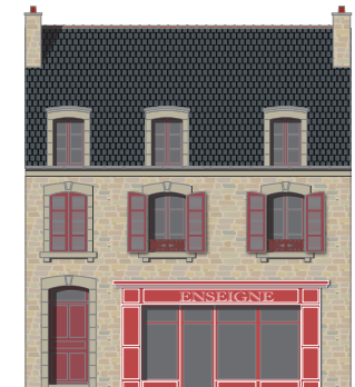
Même gamme de teintes pour l'ensemble de la façade