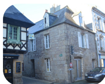
EXEMPLE D'ASSOCIATIONS CHROMATIQUES