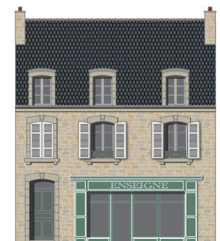
Seule la porte d'entrée est de couleur sombre, la devanture d'une couleur plus vive.