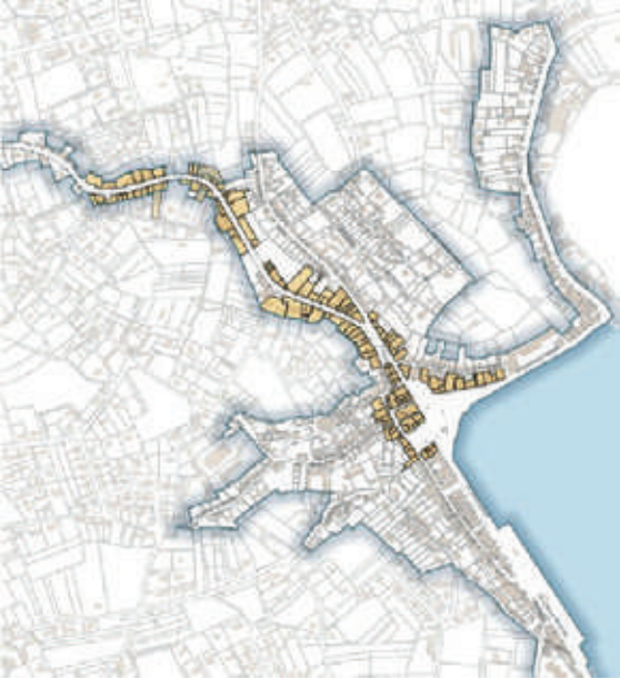
Ci-dessus les axes concernés par l’Opération programmée d’amélioration de l’Habitat.

Appel aux conducteurs Vous êtes disponible en journée, possédez une voiture et souhaitez vous engager dans cette action solidaire ? Inscrivez-vous sur www.atchoum.eu ou au 0 806 110 444 (service gratuit + prix appel). Attention, ce dispositif vient en complément des transports en commun existants. En aucun cas les trajets ne doivent être effectués hors du Cap Sizun.