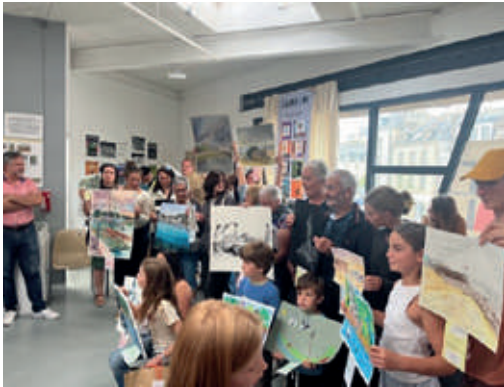
Remise des prix de l’édition 2025.