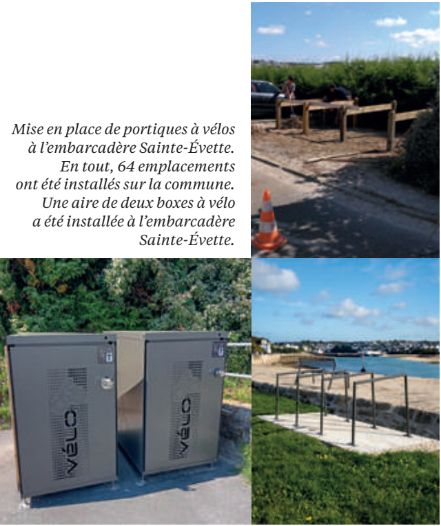
Mise en place de portiques à vélos à l'embarcadere Sainte-Évette. En tout, 64 emplacements ont été installés sur la commune. Une aire de deux boxes à vélo a été installée à l'embarcadere Sainte-Évette.

Atchoum est une solution solidaire pour vos petits trajets exclusivement dans le Cap Sizun. Cette plateforme est une mise en relation entre passagers et conducteurs pour les rendez-vous médicaux, les activités de loisirs, faire ses courses, etc. Dans le cadre de ce dispositif, les demandes des usagers sont très nombreuses. S’il existe déjà un certain nombre de conducteurs, leur nombre n’est pas tout à fait suffisant face à la demande.