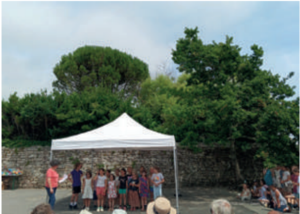
Kermesse de l’école d’Esquibien.