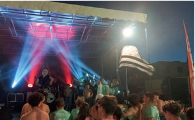
Cette année encore, le public est venu nombreux assister aux spectacles de la fête de la Musique.