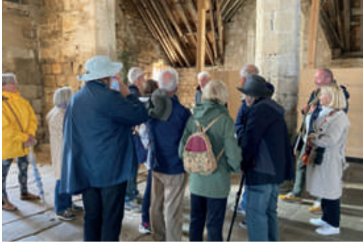
Visite de l'église Saint-Raymond.