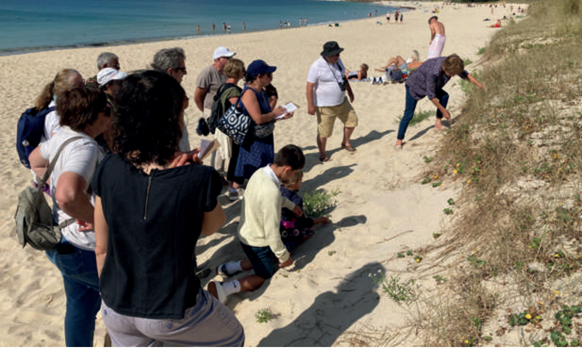
Sortie dans les dunes de la plage de Trescadec.