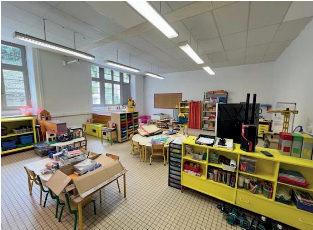
Aménagement d'une salle de classe avant l'arrivée des élèves.

Seuls les élèves de l'école Pierre-Le Lec vont suivre leur scolarité à l'espace Émile-Combes durant le temps des travaux. Les activités habituelles se poursuivent : piscine, voile et surf ainsi que des activités culturelles (cinéma et théâtre). Un projet de voyage est prévu au mois de mai sur les plages du débarquement. À Noël, les enfants participeront au marché pour vendre leurs créations.