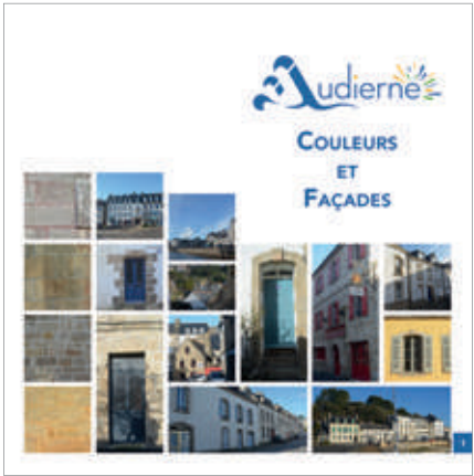
Extrait du guide chromatique Audierne – Couleurs et Façades.

Le Schéma directeur des eaux pluviales Le schéma directeur des eaux pluviales (SDEP) a pour objectif de comprendre le fonctionnement hydraulique de la commune et d’élaborer un zonage des eaux pluviales, afin de développer une stratégie de gestion. Cela servira de base pour programmer les travaux nécessaires. La commune d’Audierne se caractérise par une géographie qui nécessite une gestion des eaux pluviales rigoureuse en raison de nombreux milieux fragiles à protéger : présence de cours d’eau, zones humides diverses, bocage, rivière et estuaire du Goyen, ports de pêche et de plaisance en centre-ville.