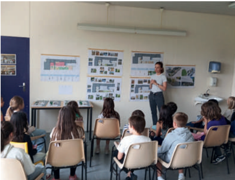
Présentation du projet aux élèves par l'architecte.

Au bourg d'Esquibien, l'aide aux devoirs se poursuit suivant les modalités habituelles. À l'espace Émile-Combes, les horaires sont désormais de 16 h 15 à 17 h 15.