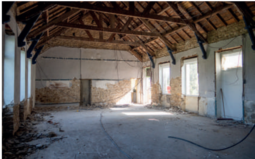
Travaux de démolition intérieure des salles.

Depuis le 29 septembre, les travaux sont en cours, pour une durée de neuf mois. Durant ce chantier, l’association La Raquette Esquibiennoise est installée aux Ateliers Jean-Moulin, à Plouhinec, et la bibliothèque accueille le public au sein du club-house du stade municipal (entrée par le parking du cimetière).