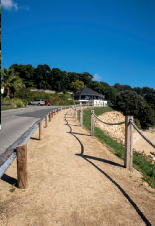
Aménagement des Capucins.

Le 17 juillet dernier s’est tenue l’inauguration des aménagements réalisés aux Capucins. Conséquence d’un ruissellement des eaux pluviales venant de la rue Kerguelen, la chaussée au-dessus de la plage des Capucins s’effondrait. Après les travaux d’enrochement, par des blocs rocheux, le chantier s’est poursuivi par la création d’un cheminement le long du boulevard Guépratte, accessible par un escalier menant au parking des Capucins. De plus, une cale d’accès en béton et en pavés a été réalisée pour accéder à la plage, la chaussée a été refaite. Une surface d’implantation et le raccordement des réseaux ont permis la mise en place d’un bloc sanitaire. Le dernier chantier a été la végétalisation des rampes.